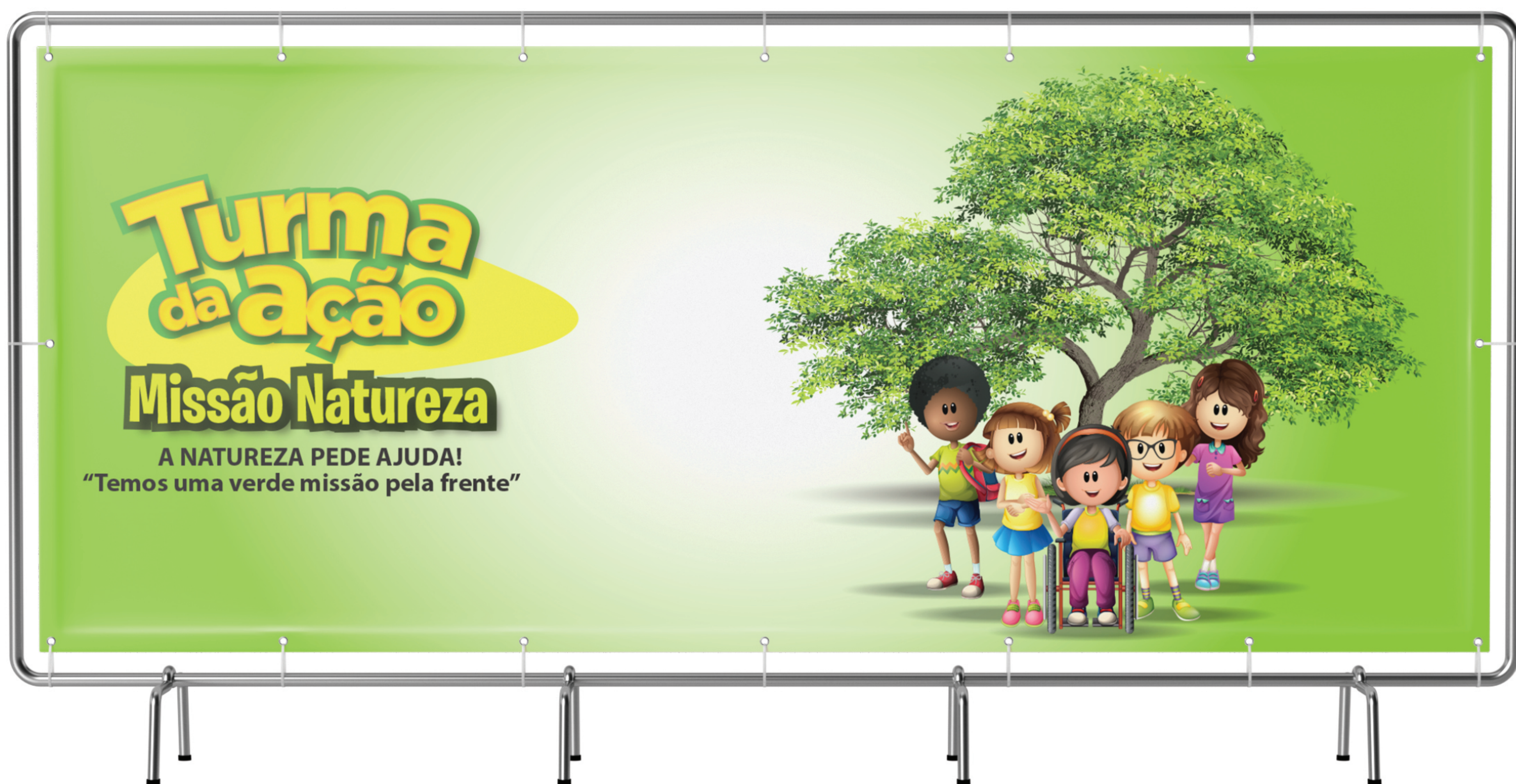
Cenário - Missão Natureza