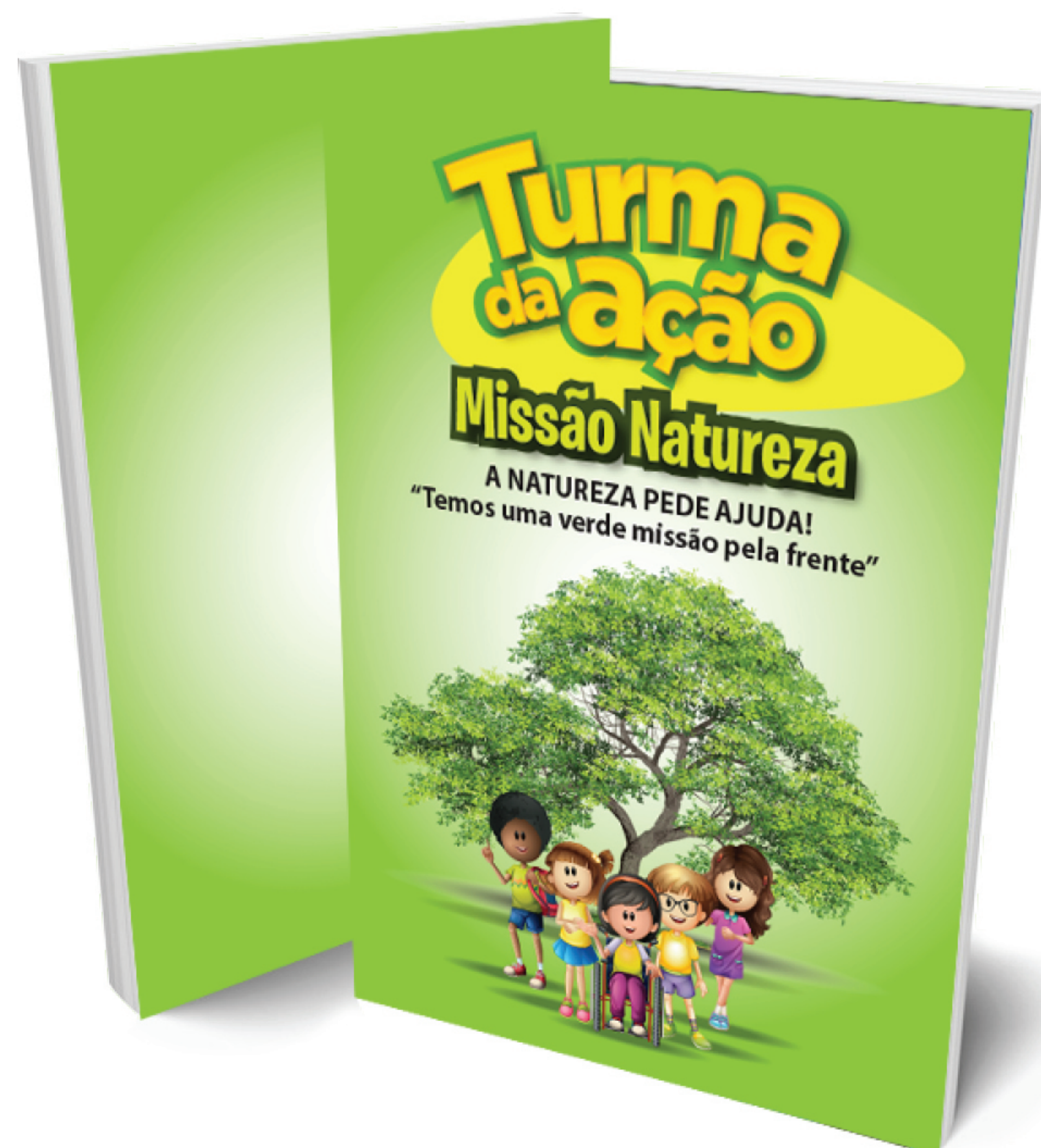
Cartilha - Missão Natureza