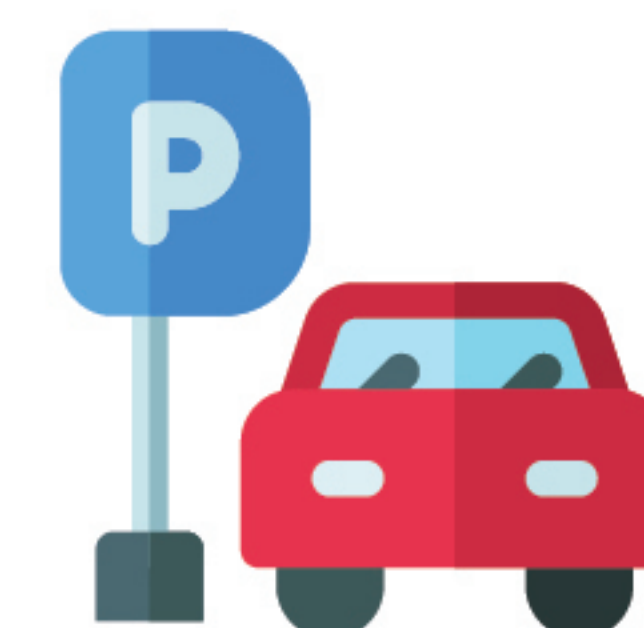
Educação no trânsito